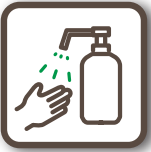
アルコール消毒液の配置