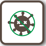
アルコール消毒済み