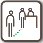
ソーシャルディスタンスの確保