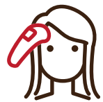
チェックイン時の検温 健康状態確認のお願い