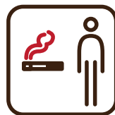
喫煙スペースの 利用定員制限