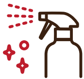
客室内の手で触れる 箇所の衛生管理徹底