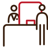
フロント 飛沫防止パネル設置