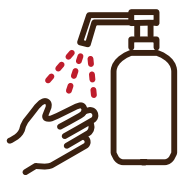
アルコール消毒液の ご利用のお願い

新型コロナウイルス感染拡大防止のため、 ソーシャルディスタンスの確保をはじめとする「新しい生活様式」を取り入れ、 お客様と従業員の安全・安心に配慮した営業をいたします。 何卒、ご理解とご協力の程よろしくお願い申し上げます。